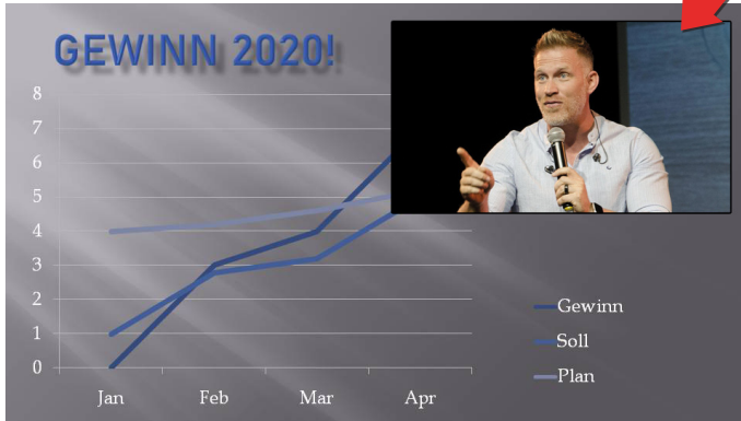
Bild-im-Bild während der Veranstaltung (wichtig bei Präsentationen)