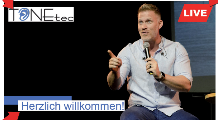
Einblendung von Beschreibungen, Untertiteln, Begrüßungs- und Abschlussbild sowie Ihres Firmenlogos

Auf Wunsch können wir die Einblendungen erstellen.